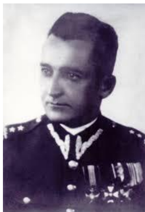
August E. Fieldorf